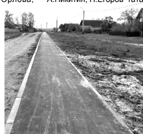
Ял варинчи сәһә тротуар.