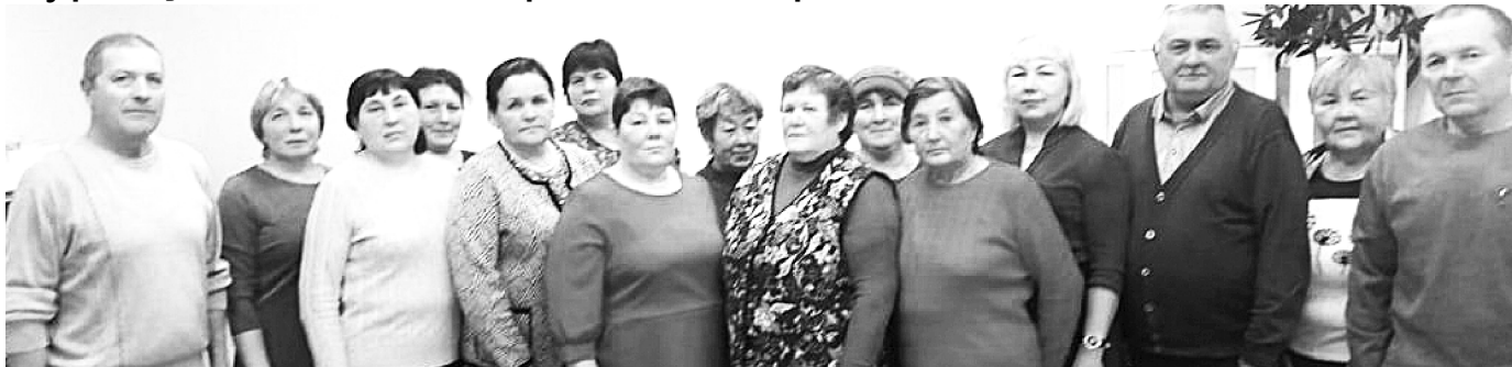
Амәшән уявәнче – пәрлехи йышла.

Мөнле пурәнать, епле сывлать паянхи чәваш ялө? Паллах, ыра өнсем те чылай, ял-йыша шухәшлаттараканни те сүк мар. Хашат страници-сенче тухакан «Паянхи ял» рубрикәна вулакан-сем кәмалпах йышәнчөс. Сәк номерте Мән Турхан территории пайән аталанәвө пирки сьрса пөлтөретпөр.