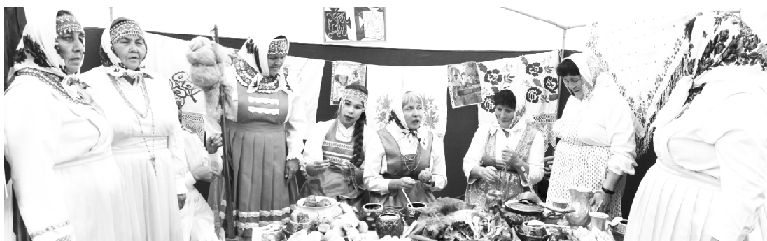
Мән-турхансем – чәвашләхшән.

Анлә уй-хирте сүлленөс паха культураөсем ситөнесө. Сөршыв пүлмисөне төштырапа тивөстөрес өнөпе кураммлә өслөсө. Выхәх-чөрлөх отраслө те аталанать. Яллә тәрәхра пурәнакансем валли вы-