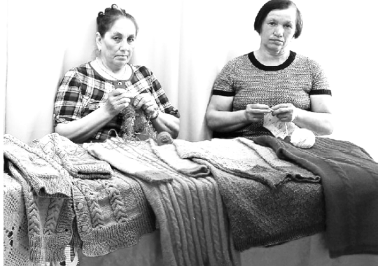
Астасөн аплинчө өс ылат.